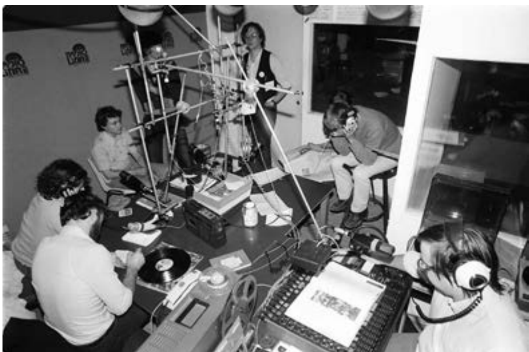
Vue du studio de Radio Louvain-la-Neuve