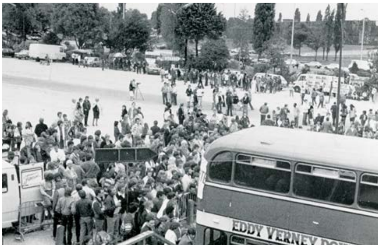
Journée de rassemblement pour les radios au Heysel, juin 1981.

Ces récits témoignent de la dynamique des radiolibristes, qui, malgré les revers subis (saisie de matériel, procès, éclatement du groupe porteur, problème financier, brouillage systématique, etc.), continuent à se mobiliser, maintiennent vivante la voix d'une radio, restent à l'écoute de leur public, des luttes sociales et des rumeurs du monde. Monter une émission, parler au micro... restent pour beaucoup une expérience importante. Les animateurs et animatrices sont des volontaires souvent inexpérimentés. L'apprentissage se fait sur le tas. Leurs émissions sont joyeuses, dynamiques, inventives, hors cadre. Être entendu reste une préoccupation qui suppose un matériel de qualité, un son audible, des sujets d'émissions qui intéressent et interpellent les auditeurs et auditrices. Leur credo : donner la parole, être à l'écoute.